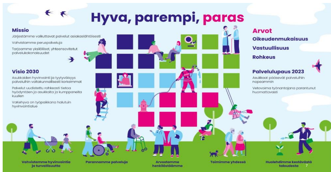
Kuva 1. Vantaan ja Keravan hyvinvointialueen strategia