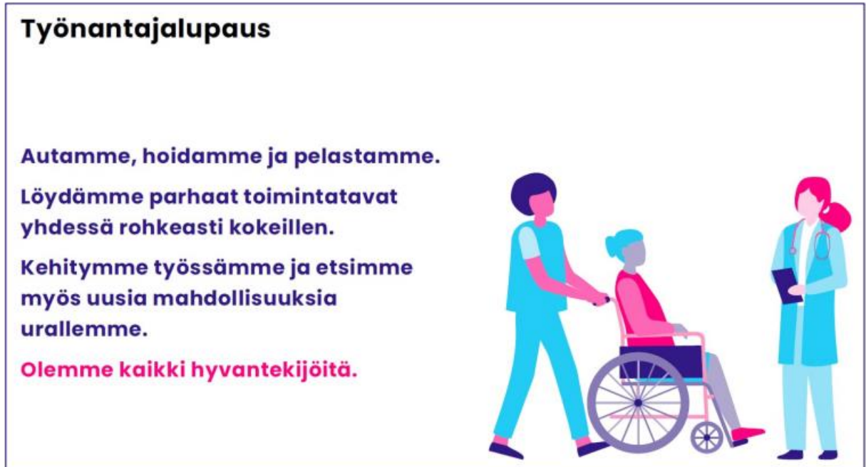
Kuva 2. Vantaan ja Keravan hyvinvointialueen työnantajalupaus.